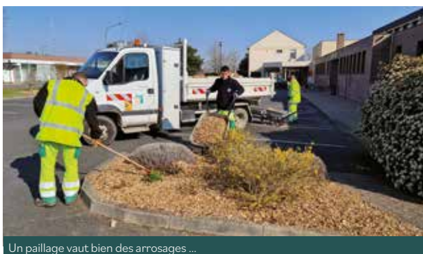
Un paillage vaut bien des arrosages ...

La préservation de la ressource en eau est un enjeu environnemental désormais partagé par tous. Les collectivités locales se doivent de montrer l'exemple en adoptant, comme les particuliers, des gestes responsables. Le service Espaces Verts du pôle Technique et Aménagement de la ville de Saint-Cyr a pris depuis plusieurs années déjà des dispositions pour réduire la consommation d'eau. C'est ainsi que le paillage des plates-bandes et massifs est désormais systématique. Les plantes sont aussi sélectionnées en fonction de leur capacité à résister au manque d'eau, par exemple dans le nouveau jardin du Presbytère.