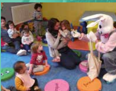
Distribution de chocolats aux enfants de la crèche