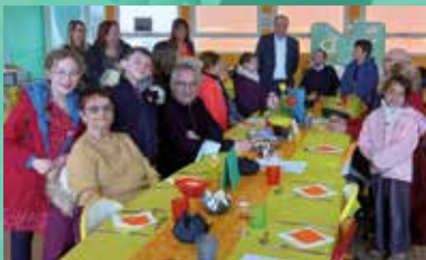
Moment de partage entre les bénéficiaires du portage de repas et les enfants de l'accueil de loisirs