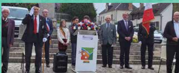
Cérémonie du 8 mai en présence des anciens combattants, du conseil des jeunes, de la réserve municipale, de la gendarmerie, la police municipale, du 12 ème régiment des cuirassiers, de la Saint-Cyrienne, du conseiller départemental et des présidents d'associations