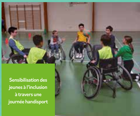
Sensibilisation des jeunes à l'inclusion à travers une journée handisport