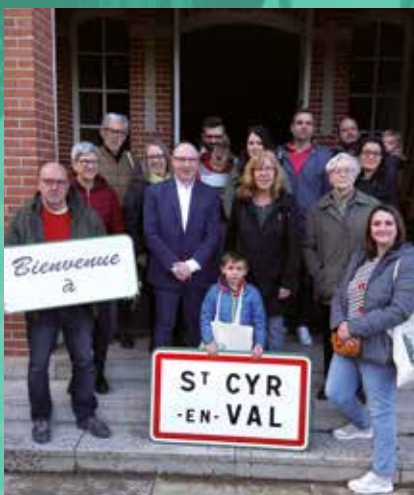
Réception des nouveaux arrivants à St-Cyr, le 1er avril