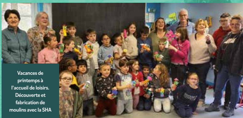
Vacances de printemps à l'accueil de loisirs. Découverte et fabrication de moulins avec la SHA